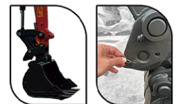
1. Abaixa a concha