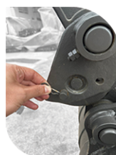
2. Tire o pino de segurança