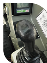
3. Pressione o botão no joystick direito