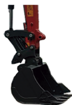
1. Abaixa a concha